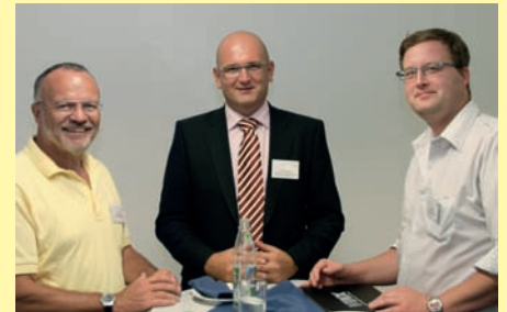
Informationstransfer und Kommunikation – natürlich auch bei dieser Veranstaltung ein wesentliches Element.

netpräsenz. So ist es möglich, online Plakate zu gestalten und diese über ein Bestellsystem direkt in den Druck zu geben. Weiter kann man mit einem ausgefeilten Buchungssystem Außenwerbeflächen für die eben bestellten Plakate an vielen Standpunkten in Deutschland reservieren. Diese Möglichkeit wird gerade von vielen kleinen Unterneh-